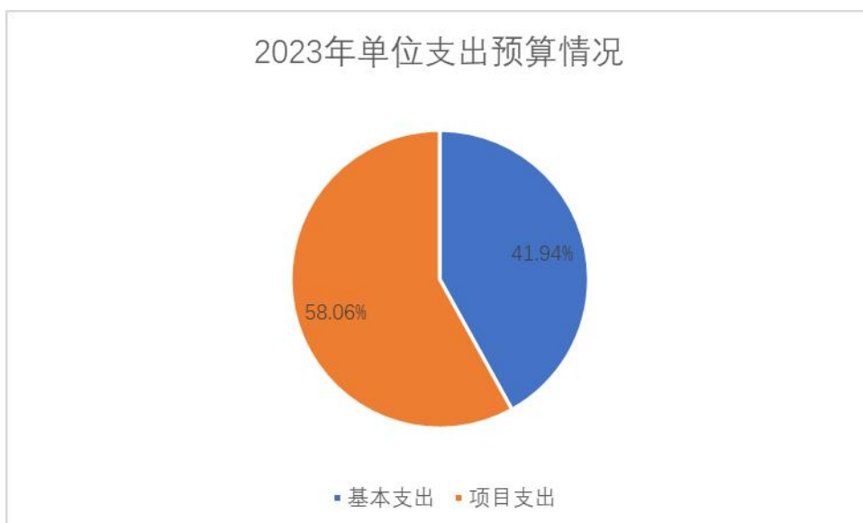
图 2 2023 年单位支出预算情况

青海大学畜牧兽医科学院 2023 年支出预算 11454.82 万元，其中：基本支出 4,804.63 万元，占 41.94%；项目支出 6650.19 万元，占 58.06%；上缴上级支出 0.00 万元，占 0.00%；事业单位经营支出 0.00 万元，占 0.00%；对附属单位补助支出 0.00 万元，占 0.00%。